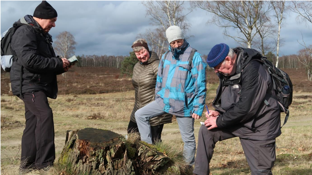
Een demonstratie geocach.

ze zien waar er boodschappen verstopt waren. Meestal waren we er al voorbij of was het te ver van het parcours. Maar een keer waren de omstandigheden ideaal. De gps leidde naar een boomstronk een twintig meter naast het parcours. Na enig zoeken werd gevonden wat gezocht moest worden, een potje in een stukje paal in een boomstronk, en konden